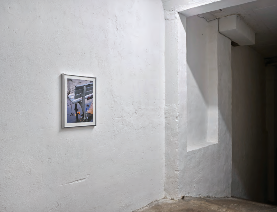
△ Stresemannplatz , 2023, Inkjet Print, 45 × 36 cm